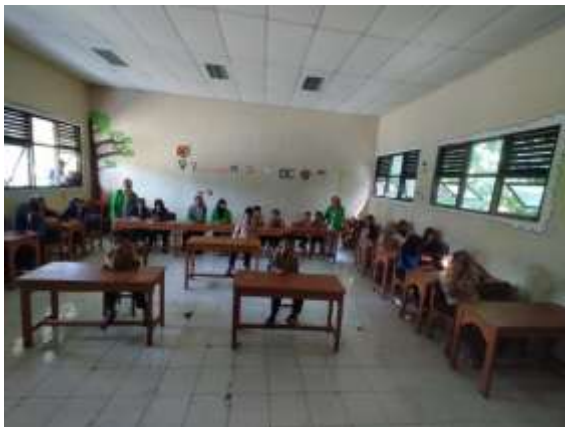
Gambar 1.2 Realisasi denah tempat duduk siswa

faktor dari karakteristik guru dalam mengajar sehingga siswa merasa kurang antusias jika denah tempat duduknya seperti itu, menurut siswa itu menjadi tidak mudah untuk lebih banyak gerak dalam belajar. Siswa tidak mudah untuk sekedar bercanda dengan teman saat belajar dan hal lainnya. Hal itu terjadi karena karakter guru yang tegas membuat siswa segan kepada guru tersebut. Akan tetapi respon sebenarnya, mereka juga merasa senang dengan denah yang sudah dirubah dapat membuat pandangan mata mereka menjadi lebih leluasa saat masuk kelas dan saat pembelajaran.